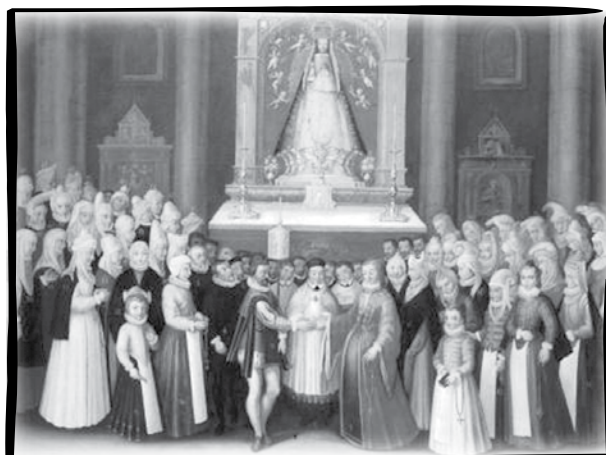
Francisco Mendieta, (1607). Ezkontza bat

Bilbao aldean eta Bizkai osoan Basilikara errores joateko oitura dago. Alan San Juan Lateralgo Basilikaz lotuta dagonez barkamen osoa lortzeko aukera dabe.